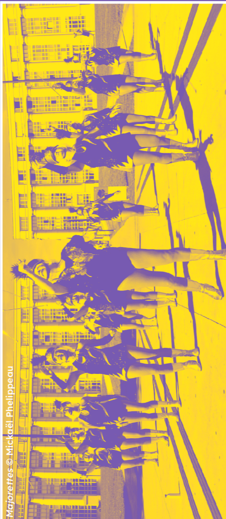
Majorettes © Mickaël Phelippeau