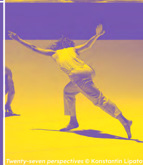
Twenty-seven perspectives © Konstantin Lipatov