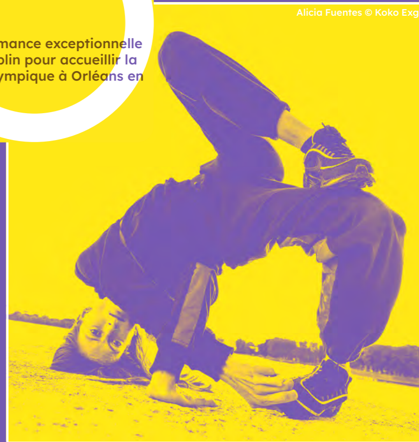
Alicia Fuentes © Koko Exg

— Gratuit Une performance exceptionnelle par Lou Orblin pour accueillir la Flamme Olympique à Orléans en danse !